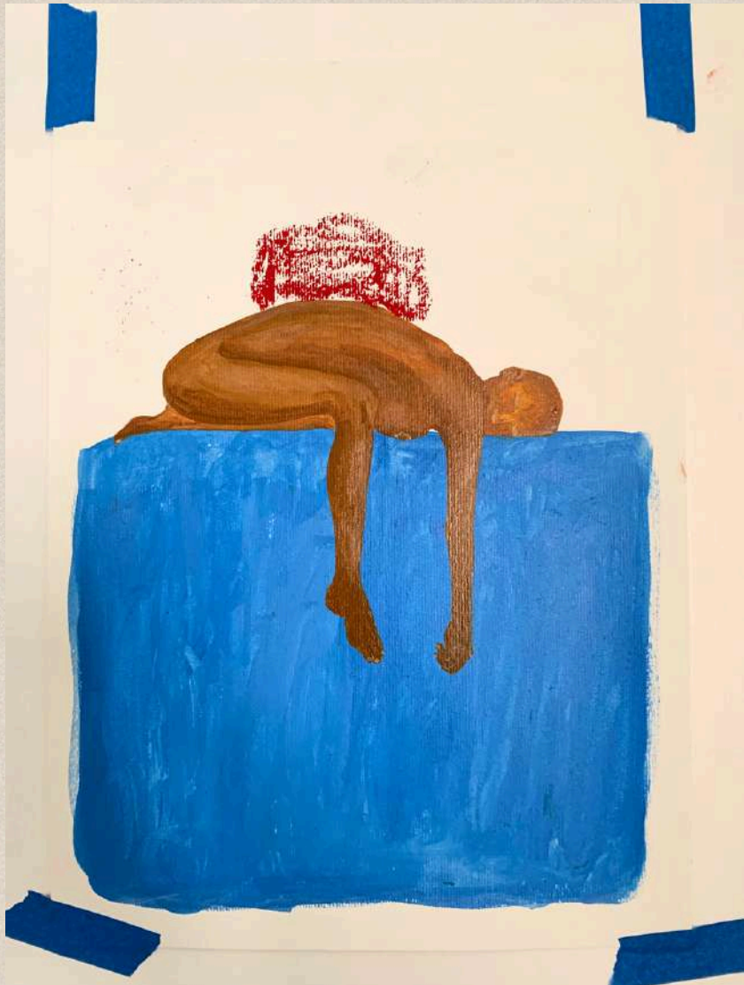
A-PESAR DE TUDO

Acrílico e pastel sobre Canson 300gr 42 x 30 cm