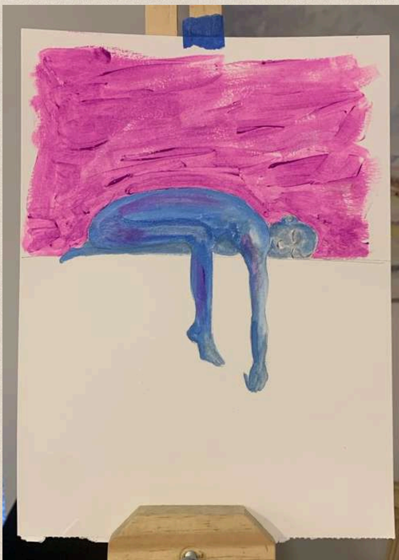
A-PESAR NEM TUDO

Acrílico sobre Canson 300gr 29,9 x 21 cm